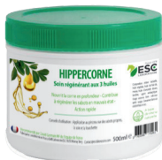
Pot 500ml ou 1L