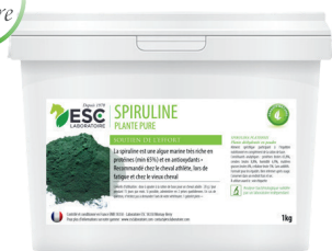
Seau 500g ou 1kg