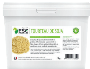
Seau 2,5kg ou 7,5kg