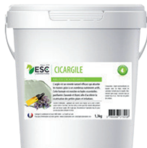
Seau 1,3 kg