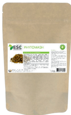
Sachet 1,5 kg ou 4,5kg

COMPOSITION : Argile bentonite, sel d'Epsom, sels minéraux, boue marine de la mer Morte, teinture mère de fucus.