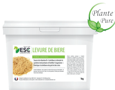
Seau 1kg ou 3kg

COMPOSITION : Lithothamne, levure de bière, arôme. Additif : 4b1702 Saccharomyces cerevisiae CNCM I-4407 5×10 12 UFC/kg.