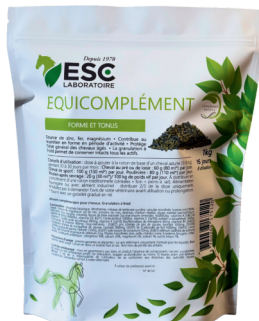
Sachet 1kg ou Seau 10kg

CONSEIL D'UTILISATION : 50g/ jour pdt 3 semaines.