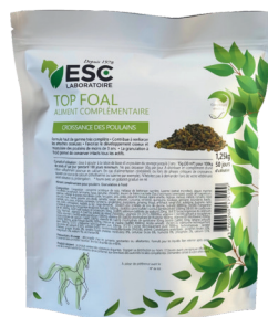
Sachet 1,25 kg

COMPOSITION : Fenugrec, fucus, graines de lin précuites, anis vert, chardon-marie, fenouil doux, lithothamne, ortie.