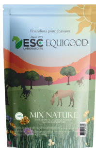
Sachet 1kg ou 5kg