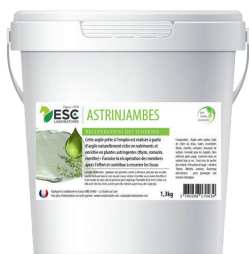
Seau 1,3kg ou 3kg