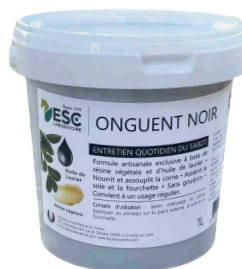
Seau 1L ou 3L

COMPOSITION : Huiles végétales (dont huile de laurier), cire, résine végétale, huile de poisson.