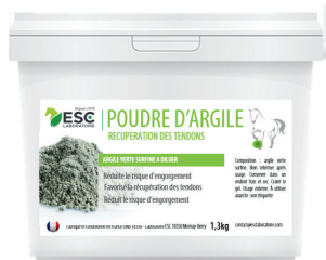
Seau 1kg ou 4kg

La couleur de l'argile rouge est liée à sa richesse en oxyde de fer. Très riche en oligo-éléments, c'est une des argiles les plus décongestionnantes. Reconnue pour soutenir la circulation sanguine et pour son action purifiante.