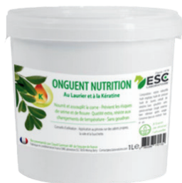
Seau 1L ou 3L

COMPOSITION : Huiles végétales (dont huile de laurier), cire, résine végétale, huile de poisson, pigment noir. Sans goudron.