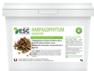
Seau 500g, 1kg ou 5kg