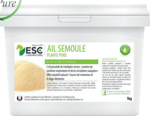
Seau 1kg ou 5kg