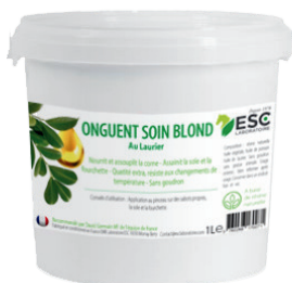
Seau 1L ou 3L