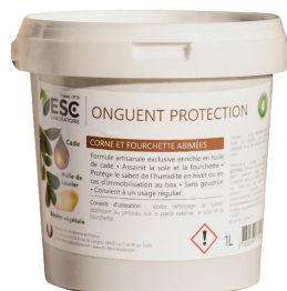
Seau 1L ou 3L

COMPOSITION : Huiles végétales (dont huile de laurier), cire, résine végétale, huile de poisson, extrait de kératine.